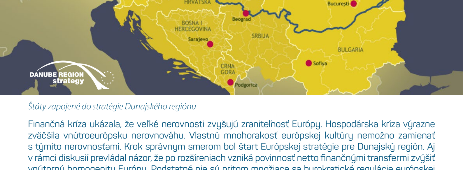
Štáty zapojené do stratégie Dunajského regiónu

Hľadiskom skúmania každodennej činnosti spoločnosti a biografie jednotlivcov, prekračujúcim hranice disciplín sa zaoberá geografia času. Táto vedná disciplína je vnímaná ako vysokoflexibilná a rozvíjajúca sa jazyk, ako spôsob uvažovania o svete v širšom ponímaní, ako spôsob uvažovania o príležitostiach, skúsenostiach alebo o obsahu života človeka. Kľúčovým termínom je virtuálna realita, ktorá umožňuje na ktoromkoľvek mieste aj čase za predpokladu, že sa plne realizujú moderné technológie.