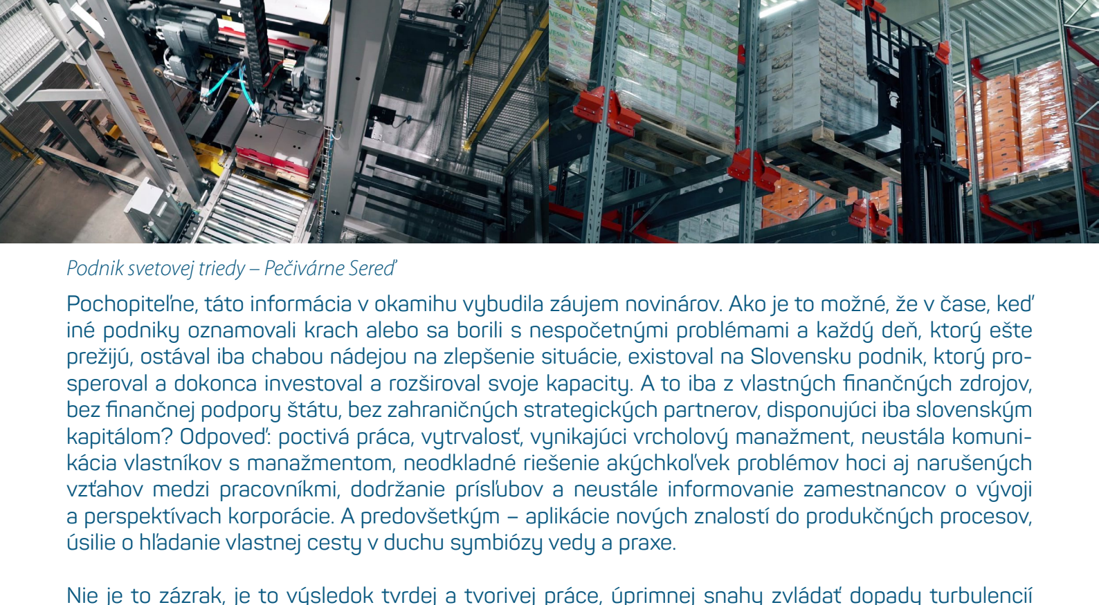
Podnik svetovej triedy – Pečivárne Sereď

Konkrétne experimenty sme v podniku realizovali viaceré. Ak skúšaný podnik, ktorého som bol tridsať rokov spoluvlastníkom niekto z návštevníkov poznal už niekoľko rokov a pride do výrobných prevádzok dnes, ten žasne. Nielenže ľudia pracujú na najmodernejších stroch svetovej úrovne, ale sa ide aj ďalej. Rozšíroli sme výrobné kapacity postavené v nového režimu. Nové investície umožnili posadiť a uplatňovať teoretické poznatky priamo v praxi, v konkrétnej výrobe. Aj v každom jednom výrobku, ktorý opustí výrobnú linku podniku. Mám radosť, že mnohé sa v podniku podarilo a sú zaznamenané trvale dobre výsledky, dokonca v čase celosvetovej krízy sa investovalo 55 – 60 miliónov EUR do rozširovania kapacít a lepšieho presadzovania sa na globálnych trhoch.